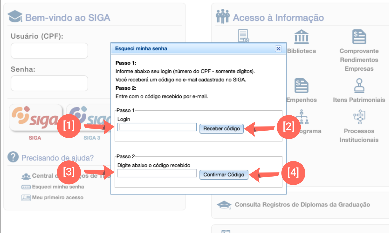
Figura 02 – Localização dos passos para recuperar senha no formulário “Esqueci minha senha” do SIGA

A janela “Resetar senha” será aberta para que seja criada nova senha, conforme ilustra a figura 03.