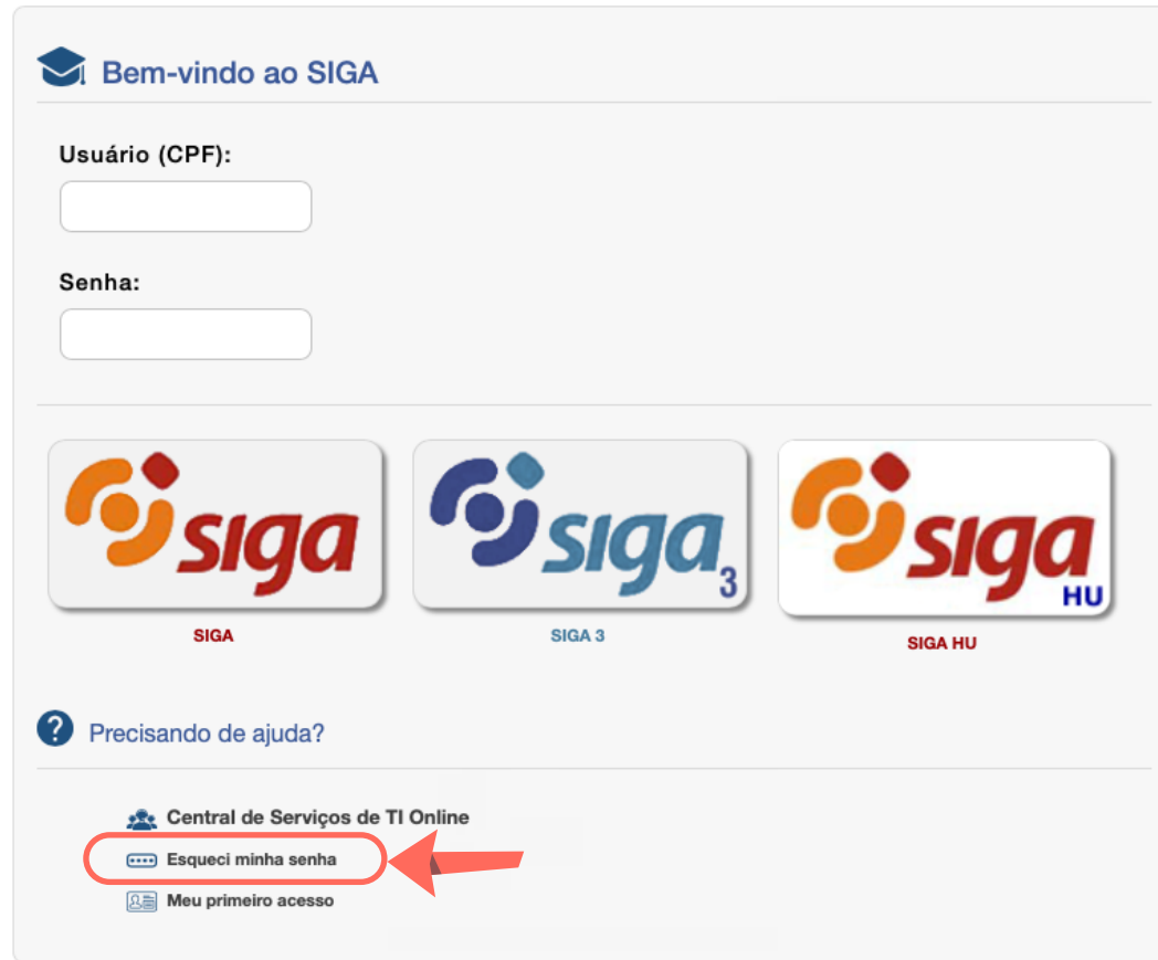
Figura 01 – Localização do link “Esqueci minha senha” para o acesso ao SIGA no site da UFJF

Uma nova janela requisitará dados pessoais, conforme ilustra a figura 02.